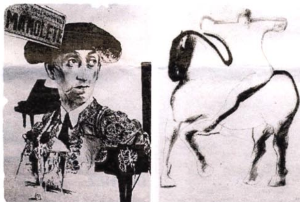
Une grande palette d'estampes à découvrir

L'œuvre originale devient multiple grâce à la relation étroite qui se noue entre le créateur et l'imprimeur